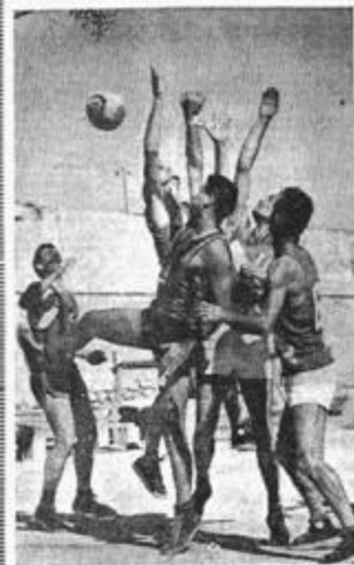
Première journée du championnat d'Algérie de basket-ball. Une scène du match Bouza-A.S.E.E. prise par les "sport et santé".