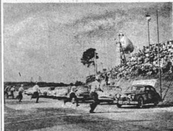
Le départ des voitures du site avant d'être donné

Pierre DUMAY et CALMELS vedettes du Grand Prix de Staouéli 59