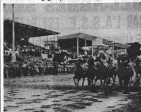
Une seule importation a eu lieu à la réunion des courses au Chenoua. On voit sur un passage de la 2 e année.