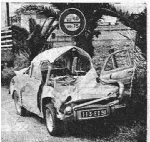
Projeté par le choc, deux des enfants ont été éjectés, par la portière ouverte ne souffrant que de légères contusions.