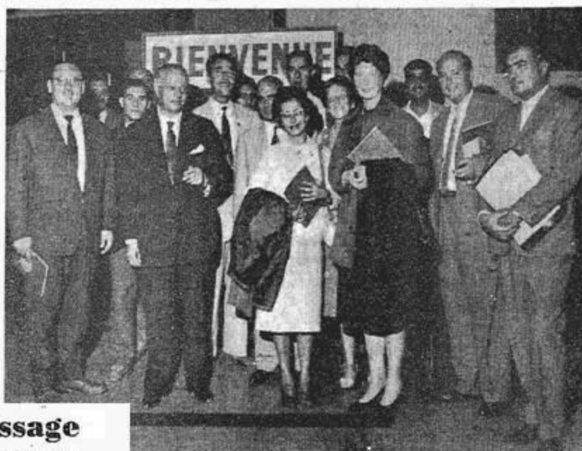
et accueillie à Maison-Blanche par MM. Uhlen, Pratin, Baldo et Fiers, directeur général de l'Algérienne de tourisme