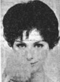
D'une légèreté aérienne, la nouvelle plume de Charles de The Rug et le fond de teint « Tint mat », donnant à votre teint le velouté et l'éclat lumineux de la jeunesse

A moins que votre choix se s'arrête sur la multitude des manteaux classiques et conçus en chevrons, tweed fantaisie, boréales, cossues, primes-de-Catins noir-blanc, esbèrtes, aux couleurs automnales estompées, tous admirablement coupés. Sur des vêtements de pluie confortables, molle-ment extensibles en droite, en gabardine de coton, Tergal et velours miteux sur lesquels l'eau glisse. F. D. 1.